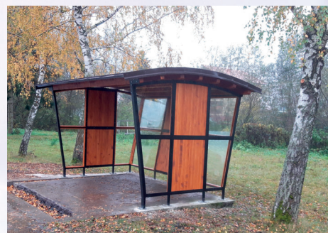
Autobusová zastávka Brestové