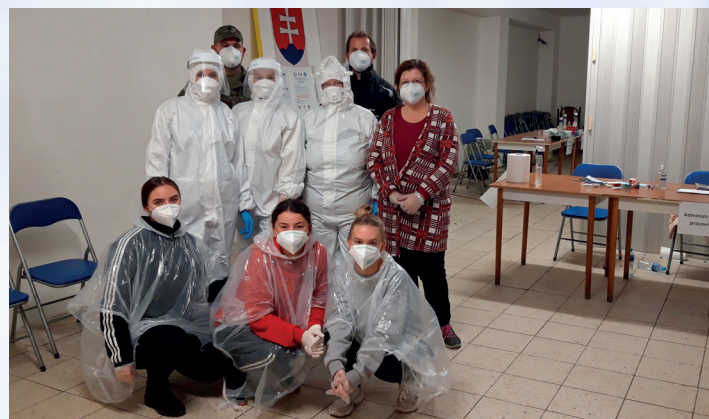
Celoplošné testovanie Bučkovec