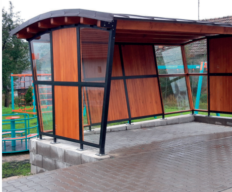
Autobusová zastávka pri bývalom obchodnom dome