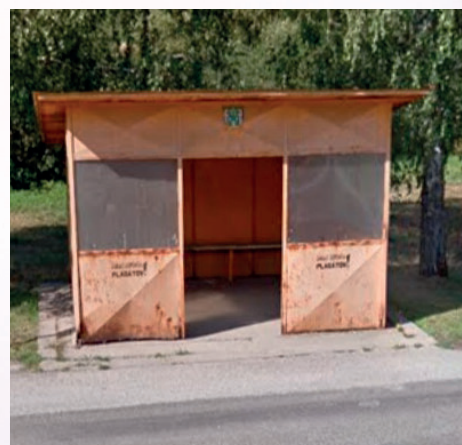
Pôvodná autobusová zastávka Brestové