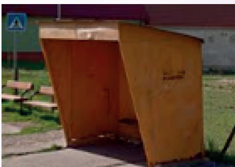
Pôvodná autobusová zastávka pri bývalom obchodnom dome