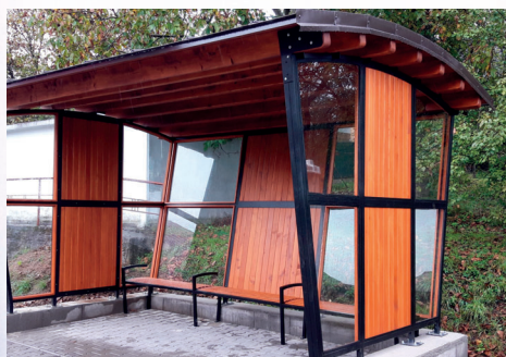
Autobusová zastávka pri Pohostinstve Trchala