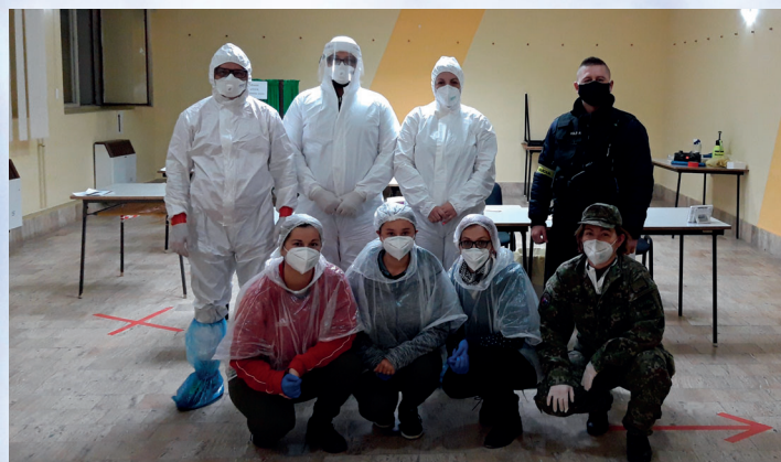
Celoplošné testovanie Moravské Lieskové

tovaných 1 879 ľudí z našej obce. Z toho pozitívne boli iba 4 osoby. Poďakovanie patrí všetkým, ktorí sa dobrovoľne podieľali na pomoci pri celoplošnom testovaní a v neposlednom rade aj obci Moravské Lieskové.